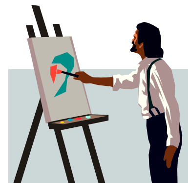
23è. CONCURS DE PINTURA RÀPIDA